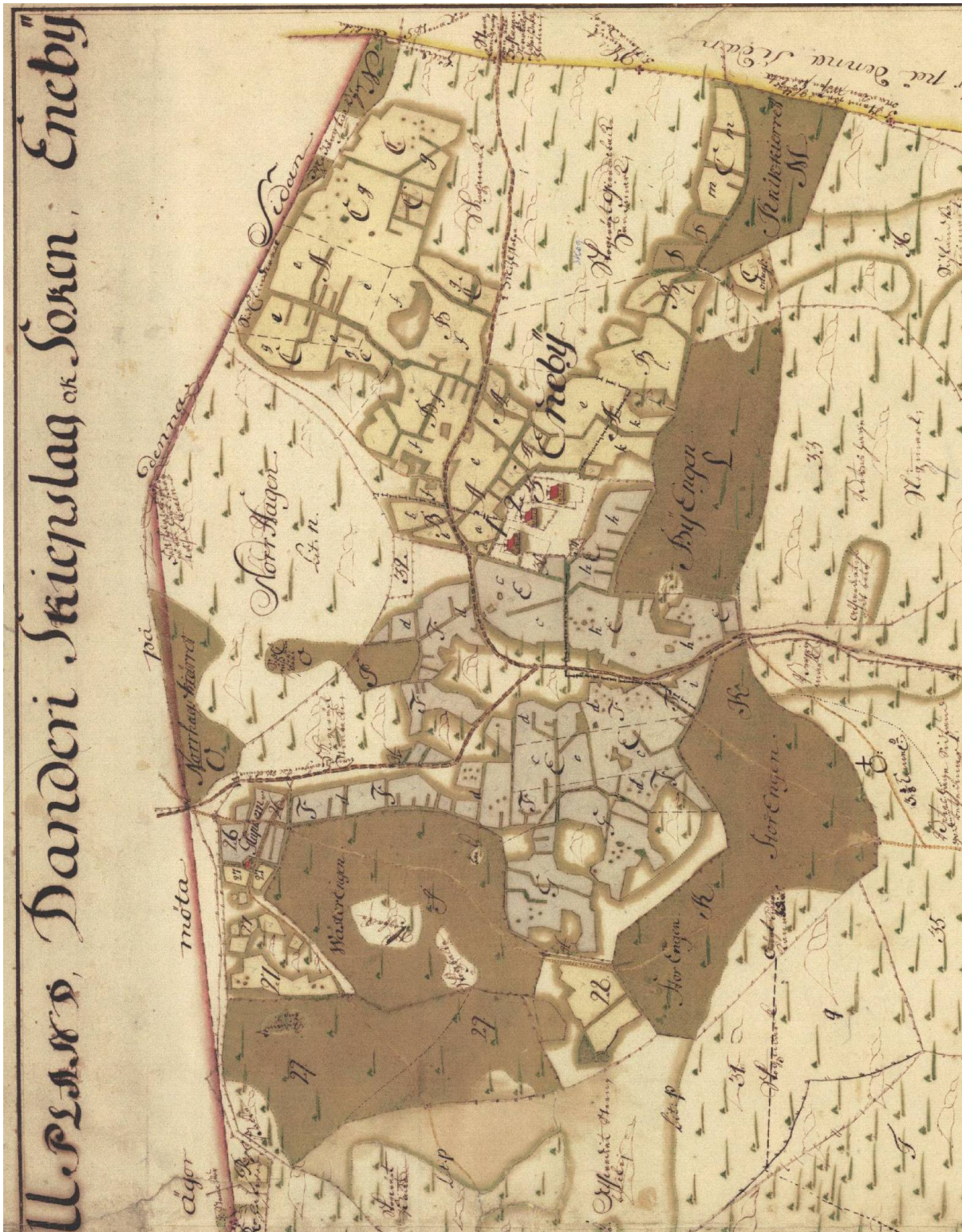
Karta över Eneby by från 1715