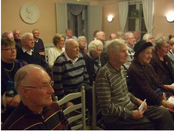
Intresserade årsmötesdeltagare i välfylld sal.