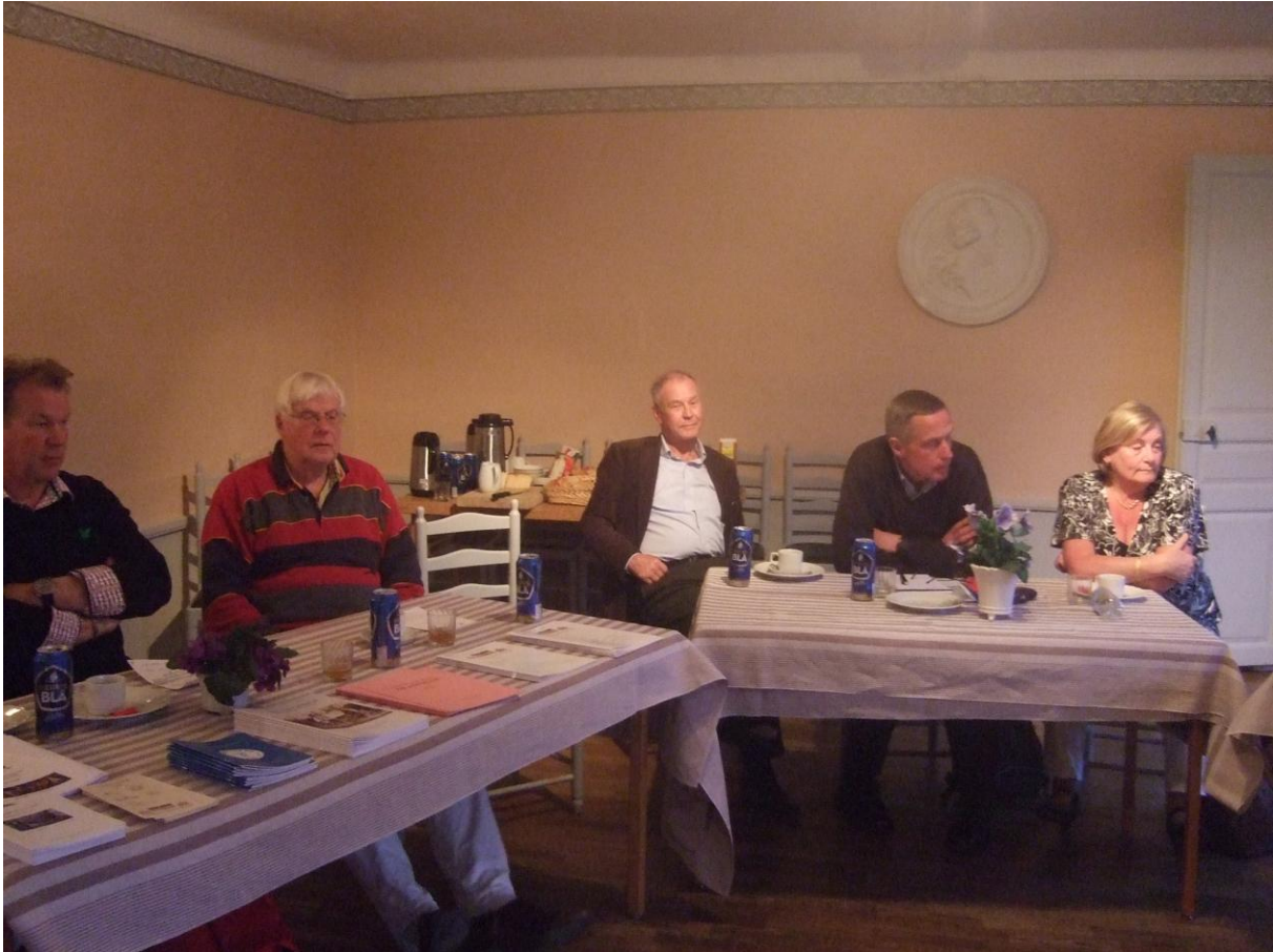
Intresserade lokala politiker lyssnar på föreningens föredragning.