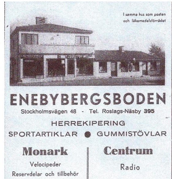
Ovan: Enebybergsboden. Enebybergs första "köpcenter" mitt emot dåvarande bussbolagets kontor och verkstad.

samt byggnationen av Folkets Hus vid nuvarande Gethagsvägen. Invånarna ställde upp mangrant och allt ideellt arbete syntes ske med glädje. Dåtidens nöjen fick man ordna själv långt ifrån nutidens utbud.