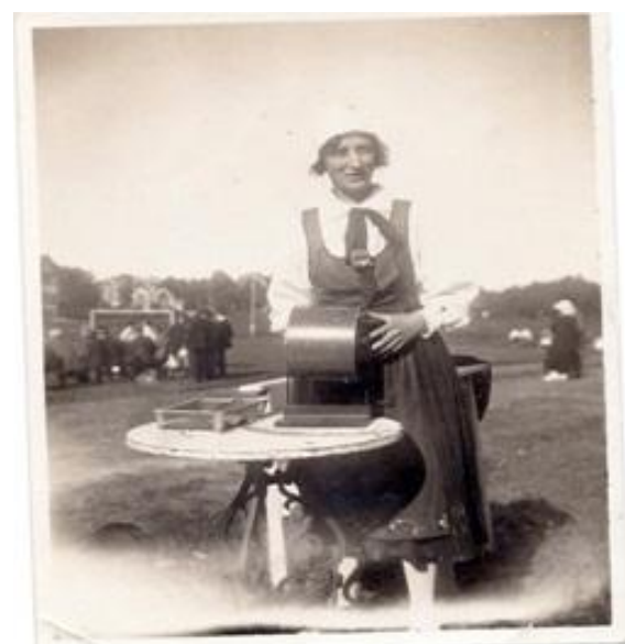
Nedan: Tombola på Getbetet tidigt 20-tal. Den ursprungliga idrottsplatsen med dansbana och festplats var belägen efter Gethagsvägen mellan Björkvägen och Idrottsvägen.