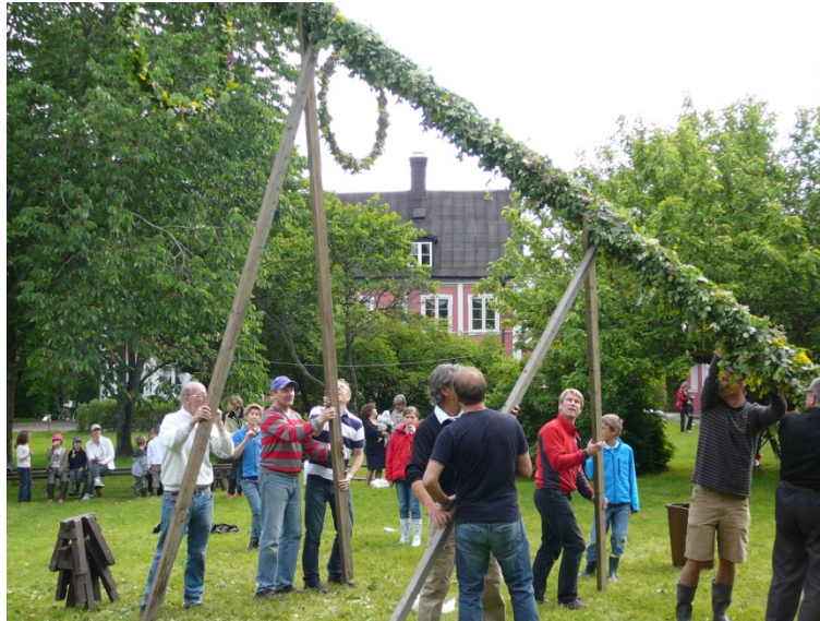
Resningen av förra årets majstång.

Fredagen den 20 juni är det dags för det traditionsenliga midsommarfirandet på Enebybergs gård. I skrivande stund räknar vi med att midsommar kan genomföras som vanligt.