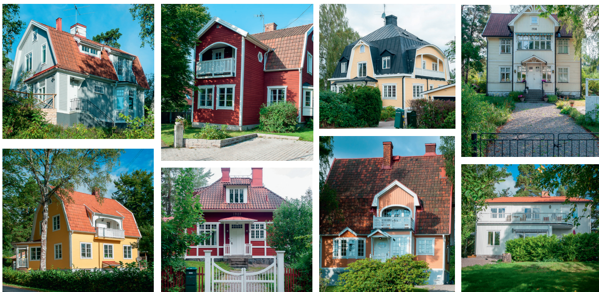
Ett urval av intressanta hus i Enebyberg.