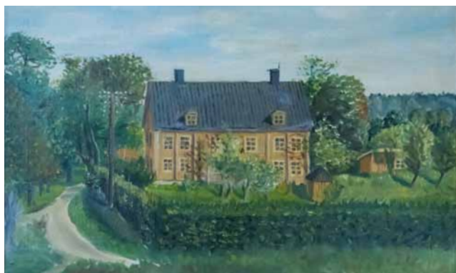
Enebybergs gård, sedd från väster. Mycket känns igen, men omgivningarna har förändrats. Målning av okänd konstnär.

Tack, alla barn, för ert intresse och era berättelser. Vi hoppas att besöken har grundlagt lite hembygdskänsla och intresse för Enebyberg, som ni kan ha glädje av i framtiden.