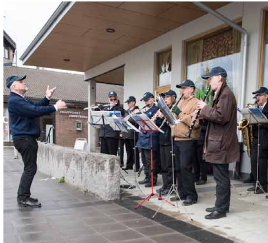
Värmusik på torget

En mångårig tradition som uppskattas av många är den lilla konsertturné runt om i kommunen som Danderyds egen blåsorkester varje år gör på förmiddagen den 1 maj. Även i år stannade orkestern till vid Eneby Torg och framförde sina traditionella vårsånger.