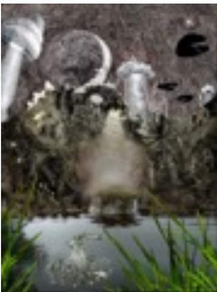
Kåge Klang Teckning, blandteknik Ringvägen 37 Enebyberg

Konstrundan pågår helgen 2–3 sept kl 12–17 På Elverket Djursholm, Danderydsvägen 4 c finns en samlingsutställning där alla konstnärer finns representerade.