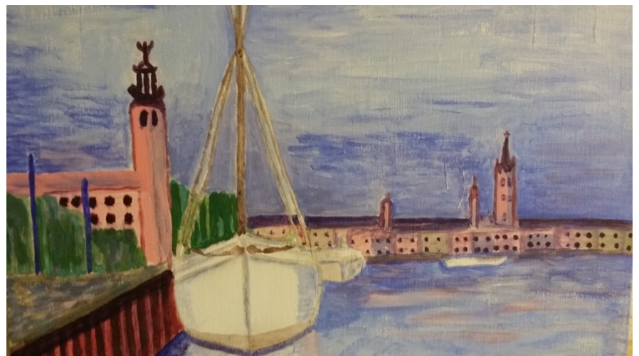
Carin Ekstrand Måleri, akryl, akvarell Ellavägen 6A Enebyberg

Karta och information om alla utställare finns att hämta på biblioteket vid Enebytorget och alla Danderyds övriga bibliotek samt på Information Danderyd.