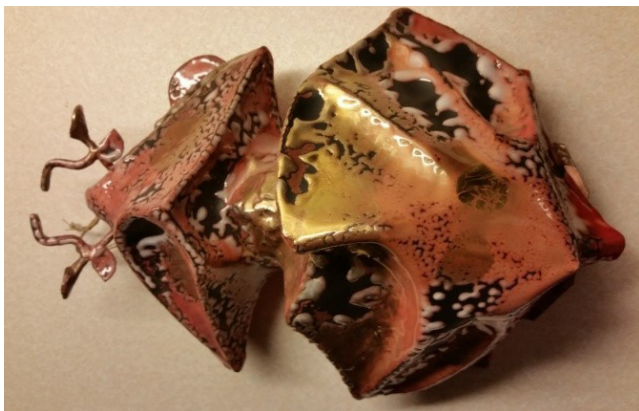
Karl Axel Pehrsons tävlingsguldbagge från 1964.

guldbagge i original från 1954. Då föddes också tanken på ett minnesmärke över Karl Axel.