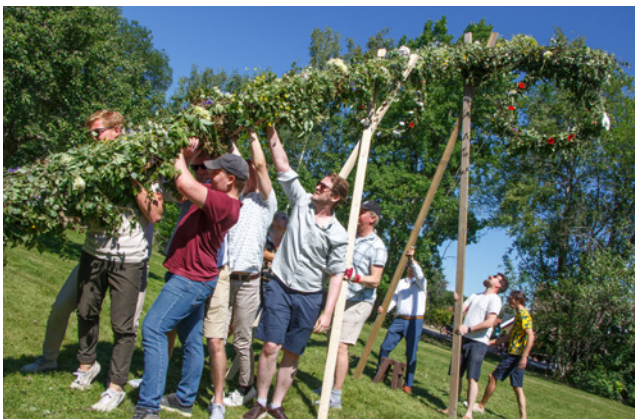
Den gamla stängen reses för hand sista gången midsommar 2022

Ta gärna cykel eller gå hit – parkeringsplatserna är få och många vill delta. Från Enebytorget är det en kort promenad. Ta med eget fika/picnic eller utnyttja möjligheterna att köpa förtäring och dricka av Triften AB.