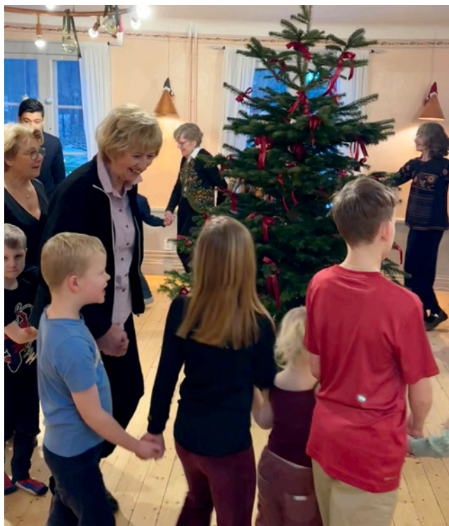
Dans kring granen

Den 8 januari kastade vi ut granen efter att ha dansat oss trötta i stora salen. Barn och vuxna deltog med liv och lust i danslekar och ringdans ackompanjerade av duktiga paret Gustafsson på dragspel och nyckelharpa.