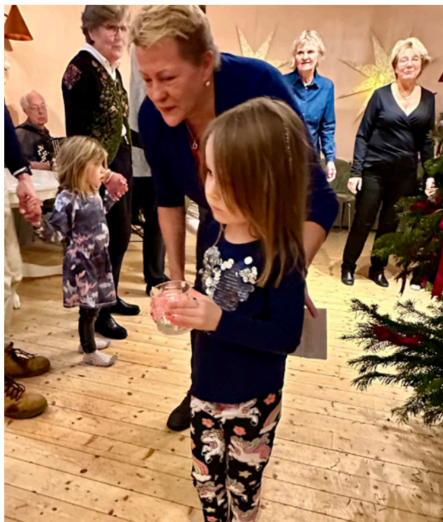
Ljusbärare i Domaredansen

I pausen bjöds det fika och spådamen Madam Marie spådde om framtiden för deltagarna. Vår härliga tomte hälsade också på och delade ut plundringspåsar till barnen.